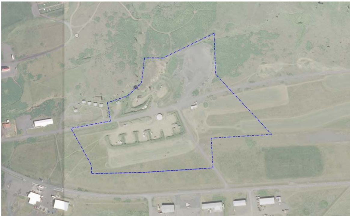
Mynd 1. Afmörkun deiliskipulagssvæðis.

Markmiðið er að auka framboð á fjölbreyttum lóðum fyrir atvinnustarfsemi og að bregðast við þörf fyrir nýjar íbúðir. Sem er í samræmi við markmið aðalskipulags Mýrdalshrepps (kafla 4.1 íbúðarbyggð), svo sem að tryggja nægt framboð íbúðarhúsaloða, gert verði ráð fyrir fjölbreyttum húsagerðum og íbúðastærðum og að íbúðarsvæði falli ávallt sem best að náttúrulegu umhverfi. Þá er áætlanin einnig í samræmi við markmið aðalskipulags Mýrdalshrepps um 20 mínútna bæinn. Deiliskipulag þetta er auglýst samhliða auglýsingu á breytingu á aðalskipulagi Mýrdalshrepps fyrir viðkomandi svæði og breytingu á mörkum aðliggjandi deiliskipulags austurhluta Víkur, íbúðar-, verslunar-, athafna- og iðnaðarsvæði.