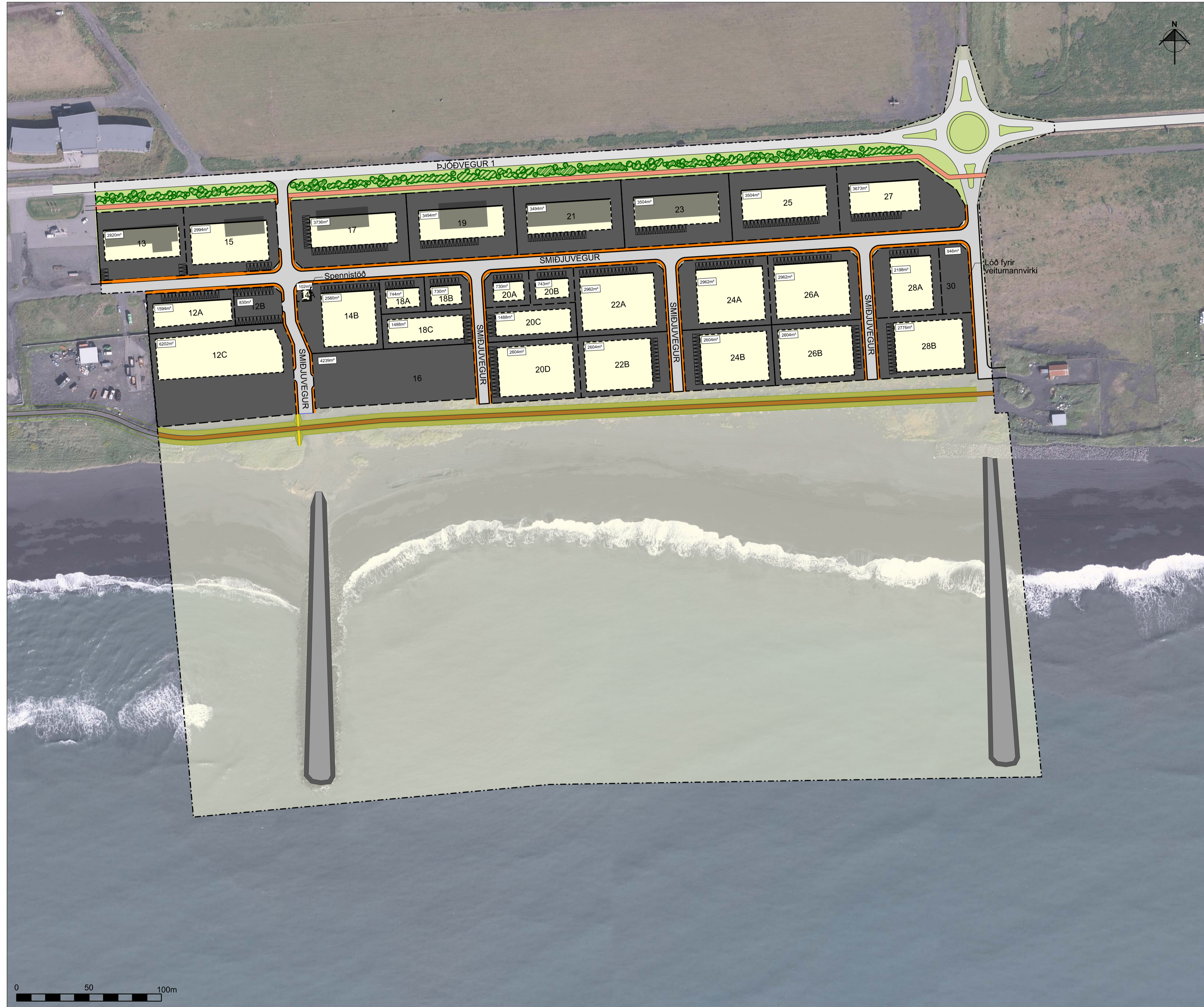
Tillaga að nýju deiliskipulagi í desember 2024, Mkv. 1:1500